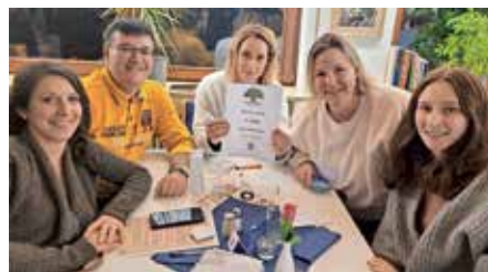
Das siegreiche Team

Die Interpreten von eingespielten Songs, die Namen von eingelebten Pflanzen etc. mussten erraten werden. Für jeden war etwas dabei. So wechselten sich die Spitzenreiter von Runde zu Runde ab, ehe am Ende das Gewinner-Team feststand. Sie konnten sich ebenso wie die Zweit- und Drittplatzierten über einen Verzehrsgutschein freuen, für die restlichen Teams gab es Trostpreise. Den Jackpot konnte keines der Teams knacken. Somit ist eine 3. Auflage nicht ausgeschlossen. Das erhobene Startgeld kam dem Förderverein und damit der Fußballjugend der A08 zugute.