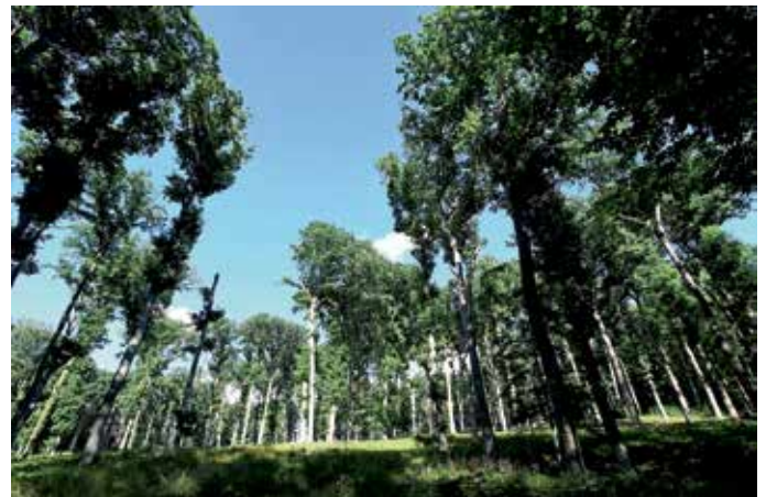
Der Müllheimer Eichwald wird künftig kleinteiliger bewirtschaftet.

Eine Sprecherin der BI bestätigte abschließend die gut verlaufenen Gespräche und signalisierte die Zustimmung zum Kompromiss für die zweite Hälfte des Forsteinrichtungswerks.